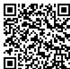
Meet our Students